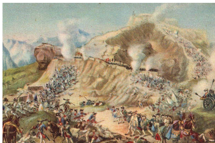
Battaglia del Colle dell'Assietta