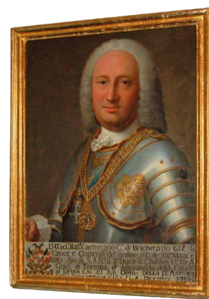
Ritratto di Giovan Battista Cacherano di Bricherasio

Il Palazzo dei Conti di Bricherasio è inserito nel catalogo dei Beni Culturali dalla Soprintendenza per i Beni Architettonici e Paesaggistici del Piemonte.